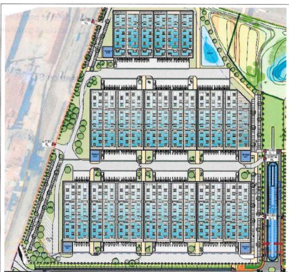
Figure 4: Exemple de projet futur à dominante logistique (3 bâtiments)