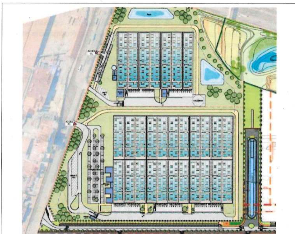
Figure 3: exemple de projet future à dominante logistique (2 bâtiments)